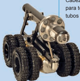
Cabezal de luz auxiliar para tener más luz en tubos largos u oscuros

Las dos orugas le permiten centrar su cámara en una amplia gama de tubos de distintos tamaños.