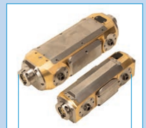
Oruga P356 Centra en tubos de 6"/150 mm a 60"/1500 mm